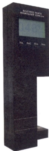
Рисунок 1 - Общий вид влагомеров нефти мобильных УДВН-1лм

Принцип действия влагомеров основан на поглощении энергии микроволнового излучения водонефтяной эмульсией.