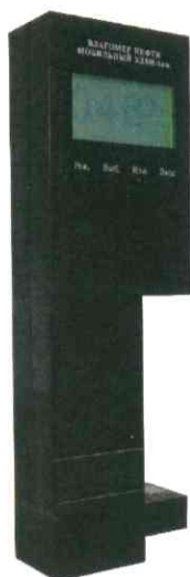
Рисунок 1 - Общий вид влагомеров нефти мобильных УДВН-1лм

Принцип действия влагомеров основан на поглощении энергии микроволнового излучения водонефтяной эмульсией.