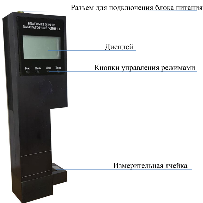
Рисунок 1 – Внешний вид влагомера нефти лабораторного УДВН-1л

1.2 Влагомер внесен в государственный реестр федерального информационного фонда по обеспечению единства средств измерений под регистрационным номером 65936-16.